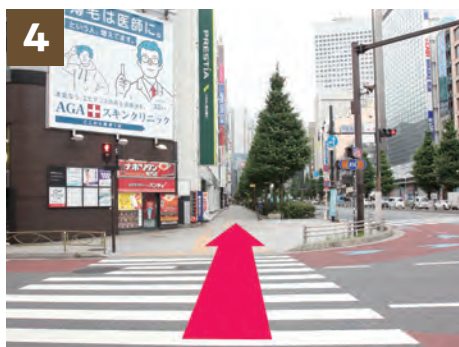
4 在“西新宿一丁目十字路口”过人行横道，右边可以看到“LUMINE 1”