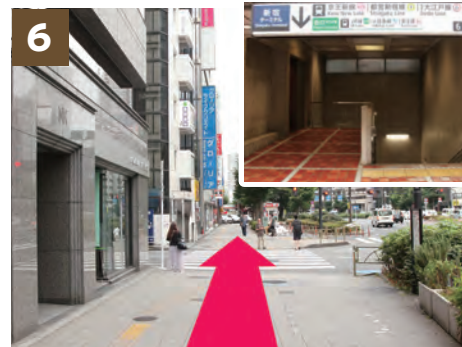
6 往“新城市中心6号出口”前通过