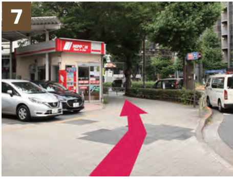
7 请您通过日本出租车公司