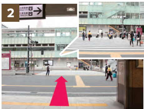
2 过驶路前方甲州街道