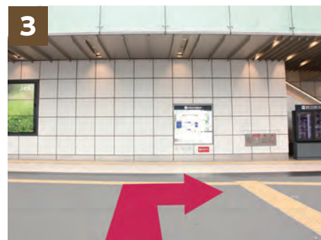
3 穿过后，沿着甲州街道向右走，新宿高速巴士总站就在您面前