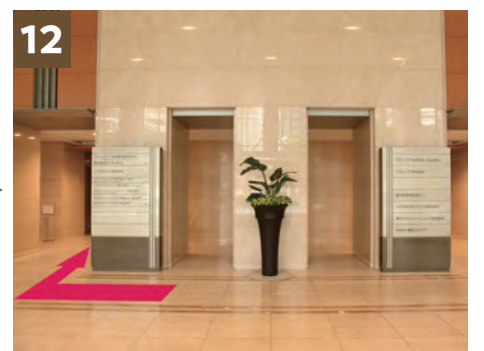
12 请您三个电梯厅中, 只使用中间厅