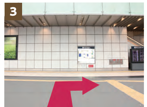
3 横断後、バスタ新宿を正面にして右へ甲州街道沿いを進みます