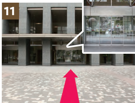
11 左右ある自動ドアより「新宿文化クイントビル」に入ります