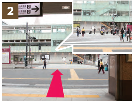
2 正面、甲州街道の横断歩道を渡ります