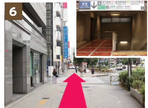
6 「新都心 出口6」を通過します