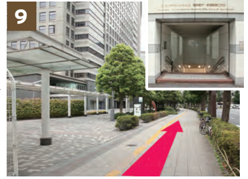
9 「ワンデーストリートO-1出口」前を通過します ※雨の日は左手の屋根がある道をご利用いただくと濡れずにお越しいただけます