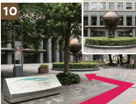
10 「新宿文化クイントビル」に到着です 「地球儀のオブジェ」が目印です