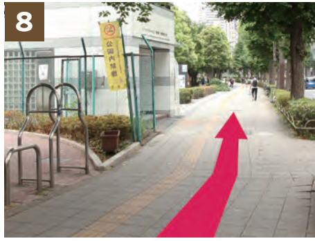
8 道なりにそのまま進みます