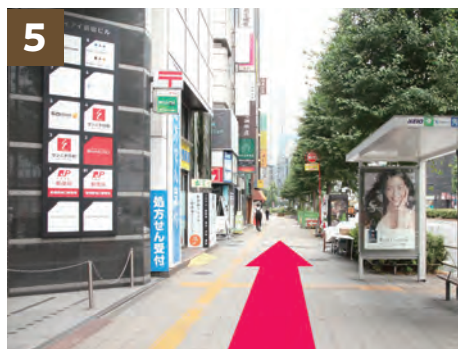
5 「角筈2丁目バス停」前を通過します